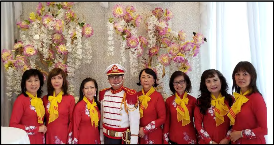
Quân phục đại lễ và những Nàng Dâu Võ Bị.